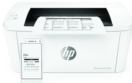
Drukarka HP LaserJet Pro M15w

Drukarka korzysta z zabezpieczeń dynamicznych, które mogą być okresowo aktualizowane za pomocą aktualizacji oprogramowania sprzętowego. Drukarka nadaje się do użycia wyłącznie z wkładami drukującymi z oryginalnym układem firmy HP. Wkłady drukujące korzystające z układów innych producentów mogą nie działać lub przestać działać. Więcej informacji: Więcej informacji znajdziesz pod adresem: www.hp.com/learn/ds